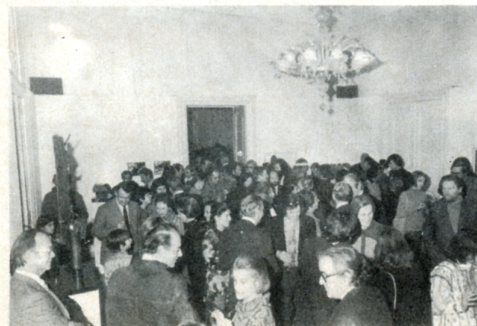
L'affollato vernissage: un giusto motivo d'incontro con l'Arte e tanti idiomi diversi a confronto per discutere esperienze diverse con esigenze comuni a tutti gli uomini di cultura.