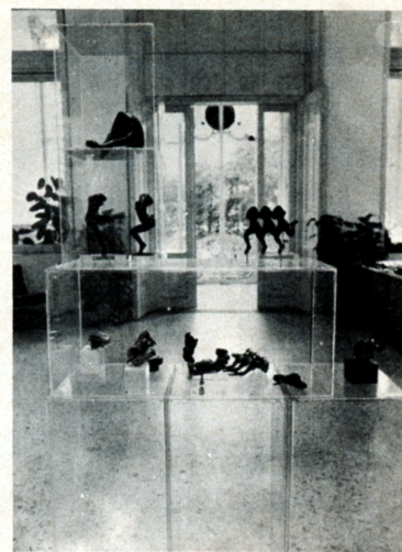
Un primo piano di sculture in bronzo.